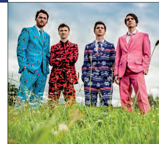
BUFFZACK, 4. MAI