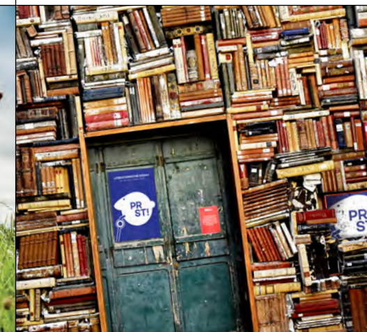
LITERATURFEST, 6. MAI

+ Moderation: Marcus Golling Musik: Liam Cairns